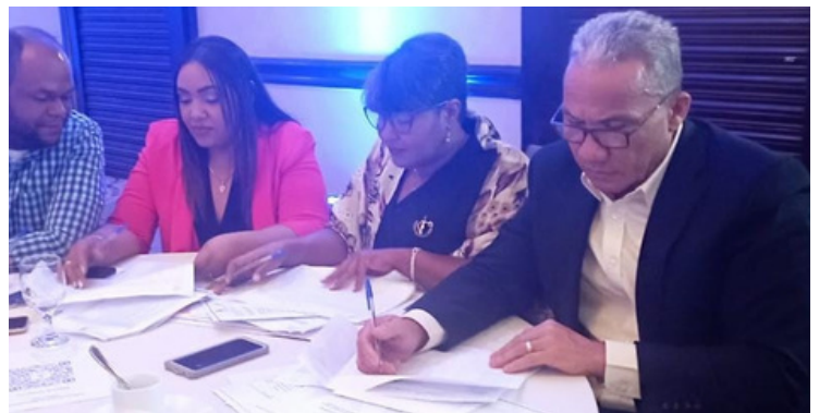
TALLER SOBRE GESTION DE ACUERDOS INTERINSTITUCIONAL