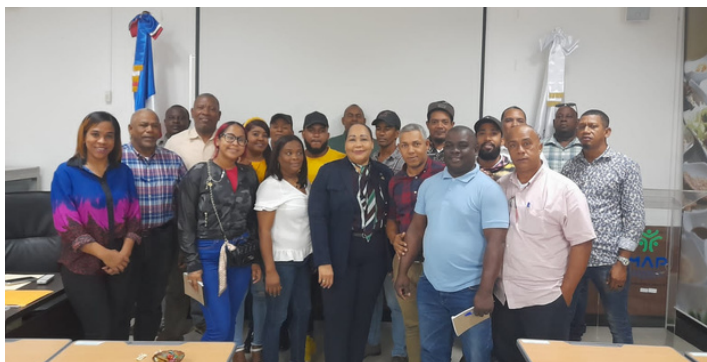
TALLER DE GESTIÓN Y RESOLUCIÓN DE CONFLICTOS,