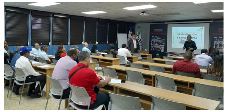
TALLER DE TRABAJO EN EQUIPO,