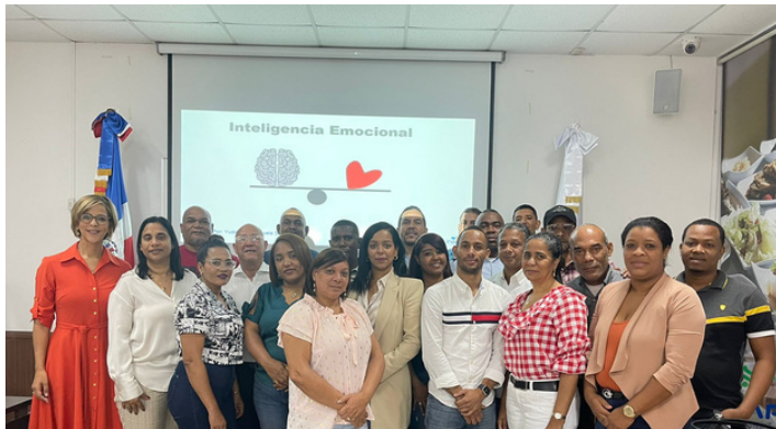
TALLER DE INTELIGENCIA EMOCIONAL